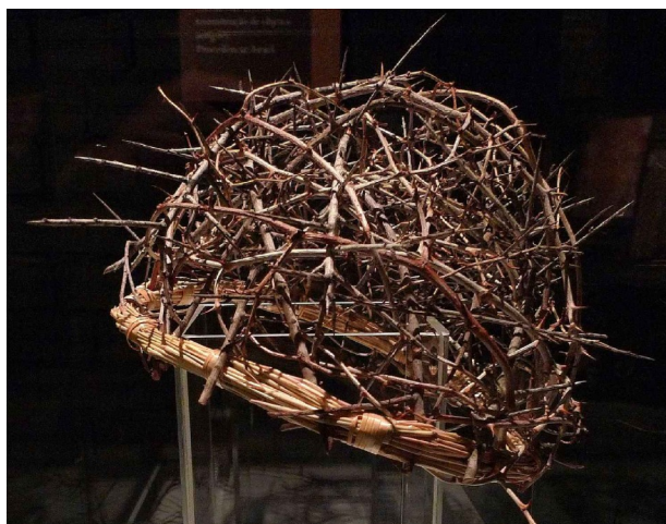
“Coroa” de espinhos segundo o Santo Sudário. Foto tirada da exposição “O Homem do Sudário”