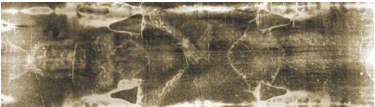
Imagens preto e branco da parte frontal do Corpo de Jesus no Santo Sudário

Em 1898, o fotógrafo da Catedral de Turim, Secondo Pia, obteve autorização para fotografar o Santo Sudário. Para seu espanto, quando viu o negativo da foto (negativo: imagem preto e branco onde a parte clara fica escura e a parte escura fica clara), o contorno do Corpo e da Face de Cristo ficou muito nítido, despertando a curiosidade de cientistas do mundo todo. Secondo Pia, admirado com a imagem formada no negativo diz “Depois de dezenove séculos, eu sou o primeiro ser vivo que vê Jesus Cristo!” . Começaram-se aí os estudos científicos no Santo Sudário e até hoje não se tem relatos de um objeto que foi mais estudado no mundo do que esta mortalha que envolveu o corpo de Jesus crucificado. Todos os estudos foram autorizados e estimulados pela própria Igreja Católica, e se intensificaram ainda mais no pontificado do então Papa João Paulo II.